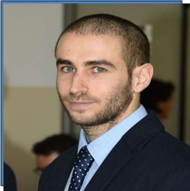
Simone Ferrari S.p.A. – Gestione Sportiva

Il Corso di Laurea in Ingegneria Magistrale in Ingegneria Meccanica di Bologna è letteralmente un trampolino di lancio per il proprio futuro, dove la rincorsa sta nella passione e negli sforzi che mettiamo nel percorrerlo, assolutamente ripagati come slancio per l'ingresso nel mondo del lavoro.